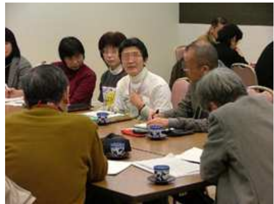
合格者ミーティング等の開催