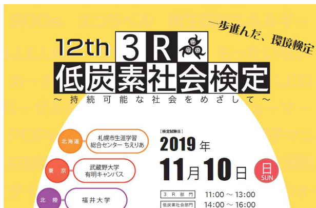
検定(第12回は全国9会場)の実施