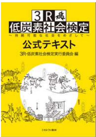
テキスト・問題集の発行