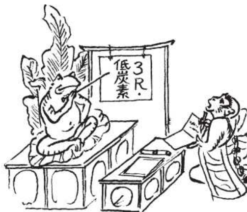
講習会(検定会場ごと実施)の開催