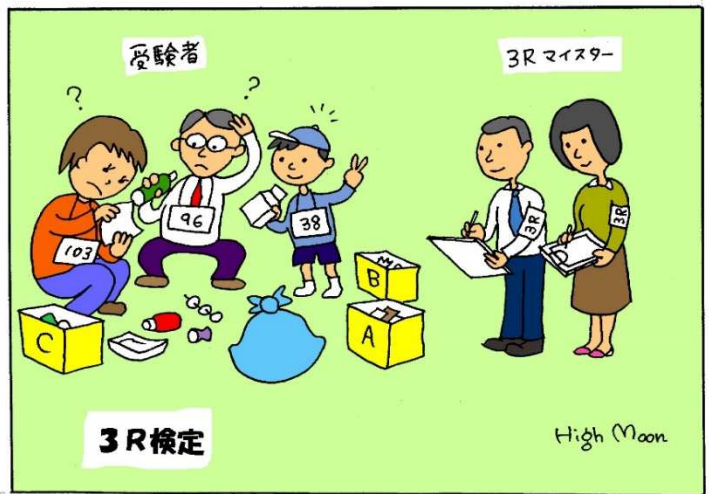
3R検定は実践行動への検定です。

法人化を機に、よりいっそう多くの方が、検定を通じて世の中で活躍できるよう、確実な運営と支援の体制を整えます。